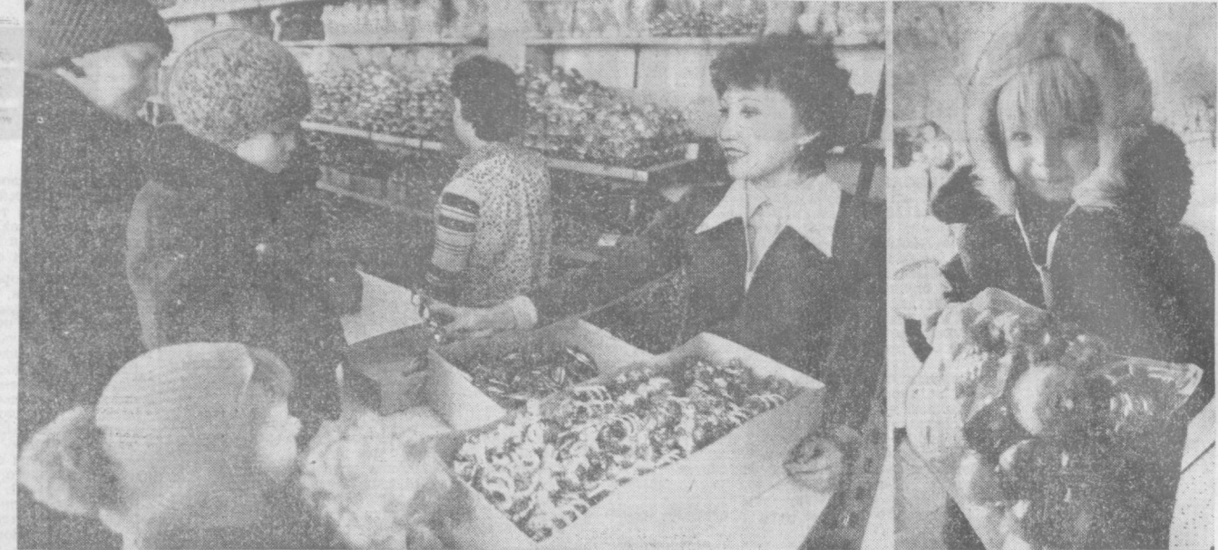
До новогоднего праздника еще две недели, но приближение его чувствуется во всем. Преобразились витрины магазинов, повсюду зазеленели украшенные елочки. Ребятишки с папами и мамами озабочены прилавки с елочными игрушками. Дворцы культуры, спортивные и концертные залы готовятся к новогодним торжествам. На снимках: у прилавков с елочными игрушками в «Детском мире».

Президиум Верховного Совета СССР присвоил генерал-полковнику Федоруку Виталию Васильевичу воинское звание генерала армии. (ТАСС).