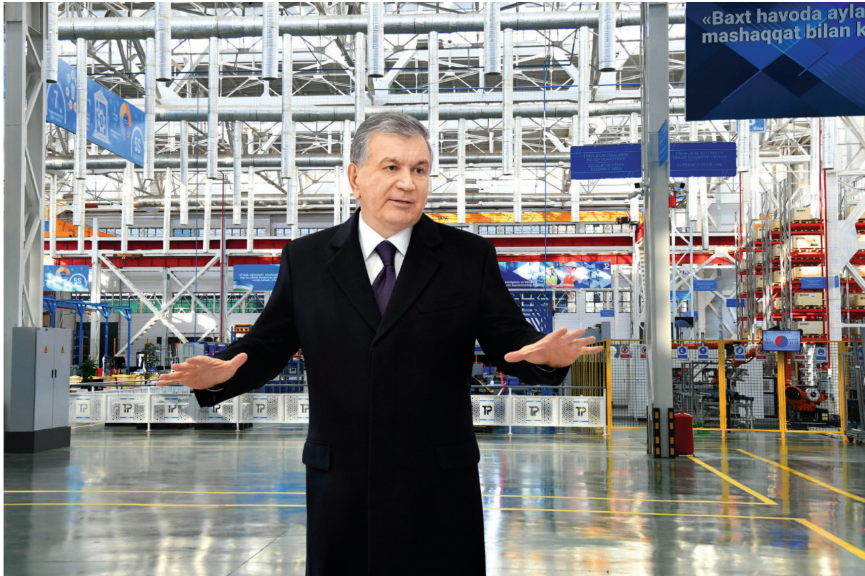
«Baxt havoda ayla mashaqqat bilan k...»

Президент Шавкат Мирзиёев 20 ноября с целью ознакомления с проводимой в городе Ташкенте созидательной и благоустроительной работой, диалога с народом побывал в районах столицы.