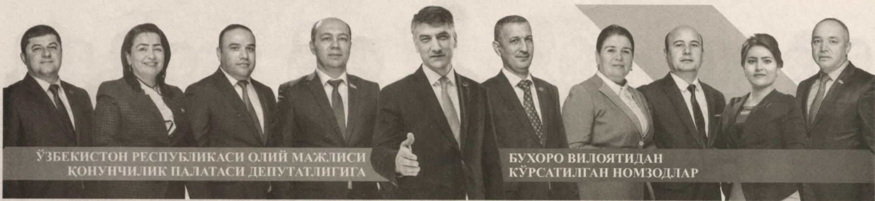
ЎЗБЕКИСТОН РЕСПУБЛИКАСИ ОЛИЙ МАЖЛИСИ КОНУНЧИЛИК ПАЛАТАСИ ДЕПУТАТЛИГИГА

✓ Фуқаролар муружаатларини ўз вақтида кўриб чиқиш, бу жараёнда сарсонгарчилик, расмиятчилик ва бефарқ муносабатга йўл қўйганлик учун жавобгарлик муқаррарлигини таъминлаш тарафдоримиз.