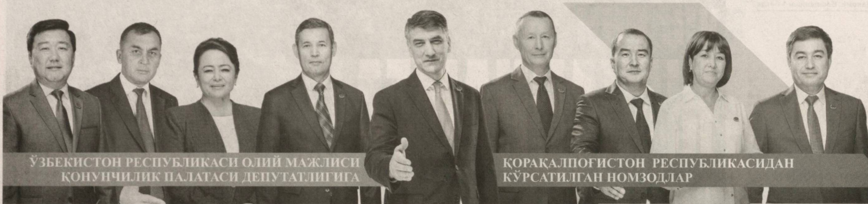
ЎЗБЕКИСТОН РЕСПУБЛИКАСИ ОЛИЙ МАЖЛИСИ ҚОНУНЧИЛИК ПАЛАТАСИ ДЕПУТАТЛИГИГА

✓ Биз давлат ҳокимияти ва бошқаруви органлари фаолияти очиқлигини, давлат идоралари ва раҳбарларнинг жамият ва халқ олдига ҳисобдорлигини оширишга хизмат қиладиган ислохотларни қўллаб-қувватлаймиз.