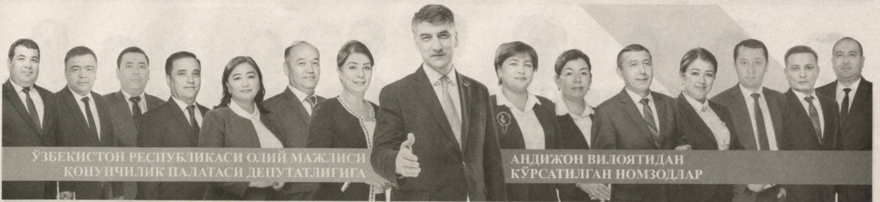
ЎЗБЕКИСТОН РЕСПУБЛИКАСИ ОЛИЙ МАЖЛИСИ ҚОНУНЧИЛИК ПАЛАТАСИ ДЕПУТАТЛИГИГА

Биз мамлакат ичкариси ва ташқарисида ўзбек тилини ўрганиш учун шароит яратиш, шу жумладан, ўзбек тилини ўргатишга йўналтирилган бепул онлайн платформаларни яратишга кўмаклашамиз.