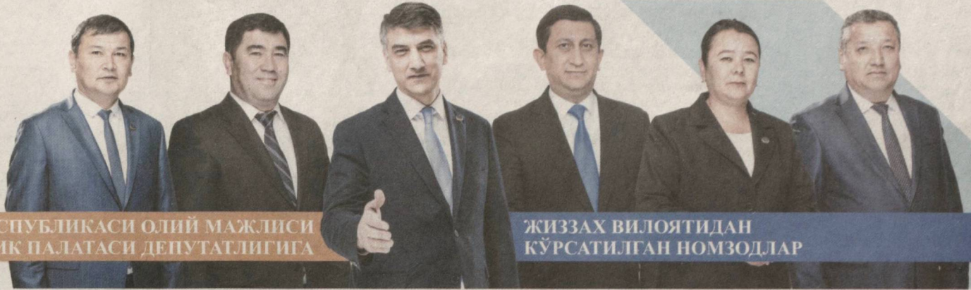
ЎЗБЕКИСТОН РЕСПУБЛИКАСИ ОЛИЙ МАЖЛИСИ ҚОНУНЧИЛИК ПАЛАТАСИ ДЕПУТАТЛИГИГА

✓ Партия кучли, барқарор ва рақобатбардош иқтисодий шакллантиришни ўзининг устувор вазифаси, деб билади. Иқтисодий муносабатларда ҳар доим индивидуал ёндашувни таъминлаш лозим, деб ҳисоблайди.