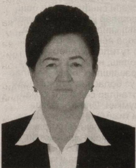
Бош Қомусимизнинг 27 йиллигига бағишланган тантанали маросимда Давлатимиз раҳбари “... уруш ва очарчиликни бошидан кечирган бобо ва момоларимиз бизга болаликдан бошлаб нонни кўзимизга суртиб эъзозлашни ўргатганлар. Бу бизнинг буюк қадриятимизга айланган”, дея таъкидлаганларида яна бир қарра тинч ва осойишта юртда яшаш хоҳиятини англагандек бўлдим.

Таълим тизими ходими сифатида давлатимиз раҳбари томонидан кўтарилган ушбу мавзунинг ниҳоятда долзарблиги, глобаллашув жараёнларида таълимдан кўра, тарбиянинг ўрни, янги авлод вакиллари ҳаётидаги роли муҳимроқ эканини соҳа вакили сифатида чуқурроқ ҳис этаман.