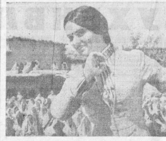
Кадр из фильма «Родившийся в грозу».

В перечень новостроек Министерства высшего и среднего специального образования Узбекистана внесено очередное дополнение: началось сооружение объектов для Наманганского и Бухарского музыкальных училищ.