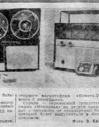
Эти модели, несомненно, будут пользоваться большой популярностью.