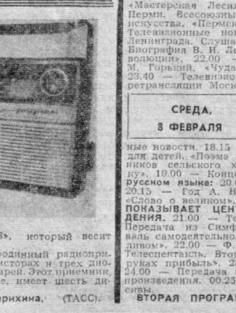
Эти модели, несомненно, будут пользоваться большой популярностью.