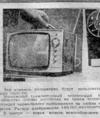
Эти модели, несомненно, будут пользоваться большой популярностью.