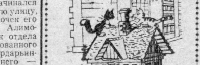
Рисунки Д. Синичного по темам Ю. Рунинова.