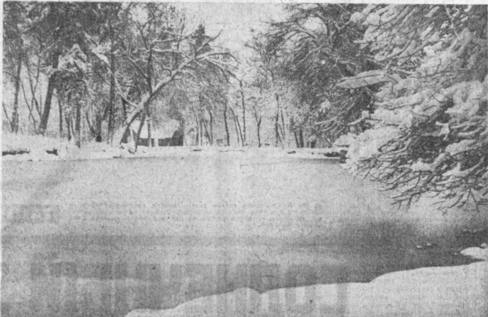
Снимок этот сделан не в Сибири и не на Урале. Объектив фотоаппарата запечатлел первый снег, выпавший нынешним годом в Самарканде.