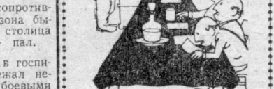
Кот кошки: дорожки нашей труппы. Скорее ее не будет.