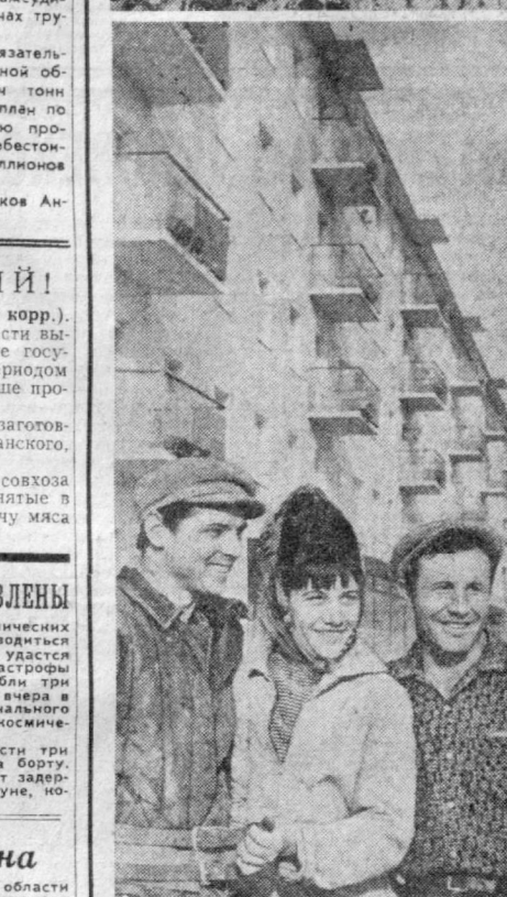
ОНИ СТРОЯТ...