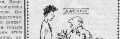
Вы нам не подходите по профессии.