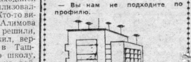
Рисунки Д. Синичного по темам Ю. Рунинова.