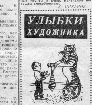
В день рождения дрессировщика.