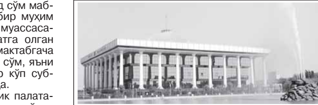
Давлат бюджети тўғрисидаги қонун лойиҳаси ҳамда солиқ ва бюджет сиёсатининг асосий йўналишлари юзасидан ўз позициясини билдирди.

Кўнун лойиҳасида бюджет соҳасига оид қатор ўзгаришлар назарда тутилмоқда. Хусусан, Вазирлар Маҳкамасига коронавирус пандемияси даврида биринчи даражада бюджет маблағларини тақсимловчи ўчун республика бюджетидан объектларни лойиҳалаштириш, қуриш (реконструкция қилиш) ва жиҳозлаш ўчун капитал қўйилмаларга ажратилмаган маблағларни бошқа биринчи даражада бюджет маблағларини тақсимловчи ўтказиш ваколати берилмоқда. Шунингдек, маҳаллий