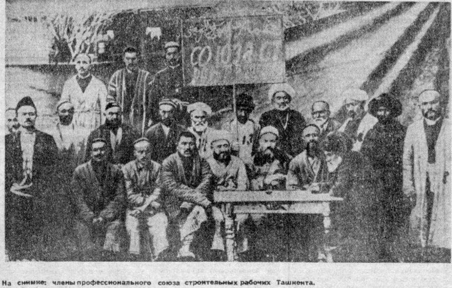
На снимке: члены профессионального союза строительных рабочих Ташкента.

ВЕЛИКАЯ Российская революция дала всему трудящемуся народу право управлять страной самому народу, а не отдельным личностям. А потому РСДРП большевиков, стоя на страже революции и завоеванной свободы, избрала депутатов в Совет рабочих и солдатских депутатов и наказывает им: быть верными партии, честно и добросовестно исполнять волю народа; не уклоняться и не отступать от требований всего трудящегося народа, идти всегда ему навстречу; не следовать за близорукой, соглашательской и гибельной политикой партий; строго исполнять указания и распоряжения рабочего и крестьянского правительства; не отступать от завоеванных позиций революции, защищать права и интересы трудового народа против мелкой и крупной буржуазии; бороться со спекуляцией и мародерством; разоблачать всему народу все злоупотребления против него; выносить протесты за уклонение от долга совести, гражданской справедливости и бездействия Совета; отдавать отчеты как партии, так и всему населению о деятельности Совета, о своей линии поведения в Совете; не запятнать своим поведением единственно передовую революционную партию, неустанно борющуюся за право всего народа с непримиримым врагом — буржуазией всех стран. Андижанская организация РСДРП(б), 5 января 1918 г.