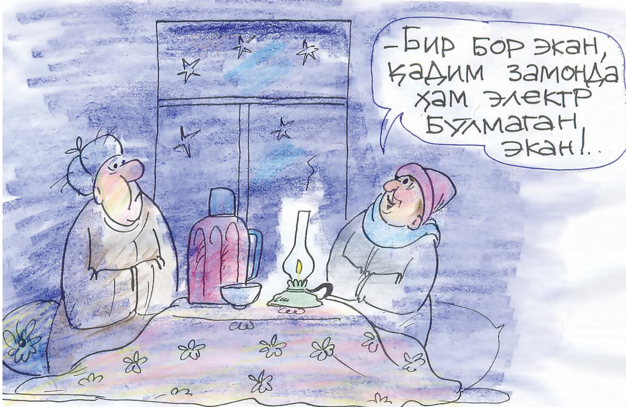
Хусан СОДИКОВ чизган карикатура.