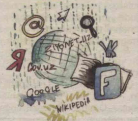
Painter: Yoqubbek HALIMBEKOV