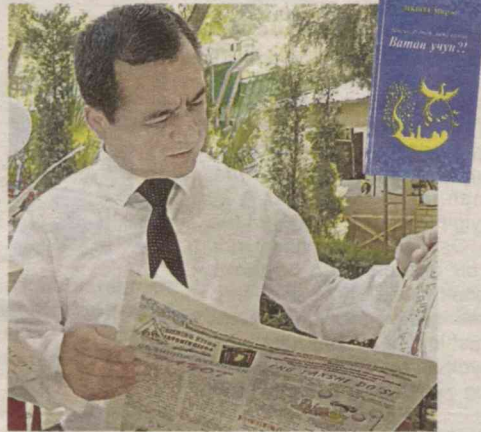
Sog'inchning sehrlil ranglari jilolanib turgan satrlardan arazlasa ham arz qilmaydigan qizaloqning