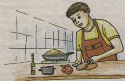
Painter: Yoqubbek HALIMBEKOV