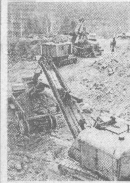
Байкало-Амурская магистраль, ставшая Всесоюзной ударной комсомольской стройкой, протянется на 3200 километров и откроет доступ к богатейшим природным кладовым. На снимке: добыча грунта для земляной насыпи дороги.