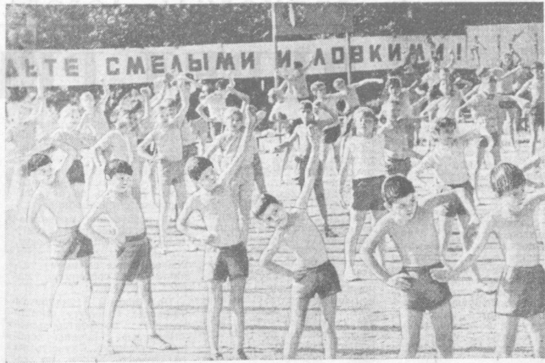
В пионерском лагере «Комсомолец», расположенном в живописных горах близ Юсулхана, отдыхают около 600 детей рабочих и служащих завода «Ташкентстальмаш». На снимке: лагерный день начинается с утренней физзарядки. Впереди походы, игры и спортивные состязания.

Ташкенте. Есть у комбината и ночной санаторий, и множество детских садов, яслей. Ну, конечно, Дворец культуры, стадион, бассейн, всего не перечислять. За 40 лет комбинат выпустил более 4,5 миллиарда метров тканей. Ими можно одеть все нынешнее население СССР. Текстильный комбинат не просто предприятие, производящее красивые ткани. Он стал кузницей кадров. Здесь в разное время готовились специалисты для Горьковского, Чимкентского, Душанбинского, Алма-Атинского и Фрунзенского текстильных комбинатов. Комбинат дал жизнь новому району Ташкента — Фрунзенскому. Со временем он превратился в один из крупнейших промышленных, научных и культурных очагов столицы. Здесь множество школ, текстильный и педагогический институты, предприятия энергетики и машиностроения, обувная промышленность, завод стройматериалов, керамический завод... В годы Великой Отечественной войны комбинат внес большой вклад в победу советского народа. 21 января 1944 года был опубликован Указ Президиума Верховного Совета СССР о награждении нашего «Текстиля» орденом Трудового Красного Знамени. Комбинату вручили на вечное хранение переходящее Красное знамя Государственного Комитета Обороны СССР. Сейчас наш родной «Текстиль» на трудовой вахте в честь 50-летия Узбекской ССР и Компартии Узбекистана. Он идет к юбилею в полном расцвете сил, энергии, молодости. А. НОВИКОВ. Ветеран Ташкентского текстильного комбината.