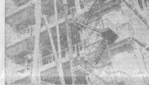
На снимках: сверху — в июле нынешнего года на Денауском машиностроительном заводе была пущена вторая очередь мощностью 420 тонн зерна в сутки; внизу — коллектив Термезского порта в первом полугодии переработал 165,3 тысячи тонн народнохозяйственных грузов...

В области функционируют более 80 сельских клубов на 7.500 членов, почти 450 алтеп и алтепных пунктов. Нет ни одного сельского отделения поселка, где не было бы фельдшерско-акушерского пункта.