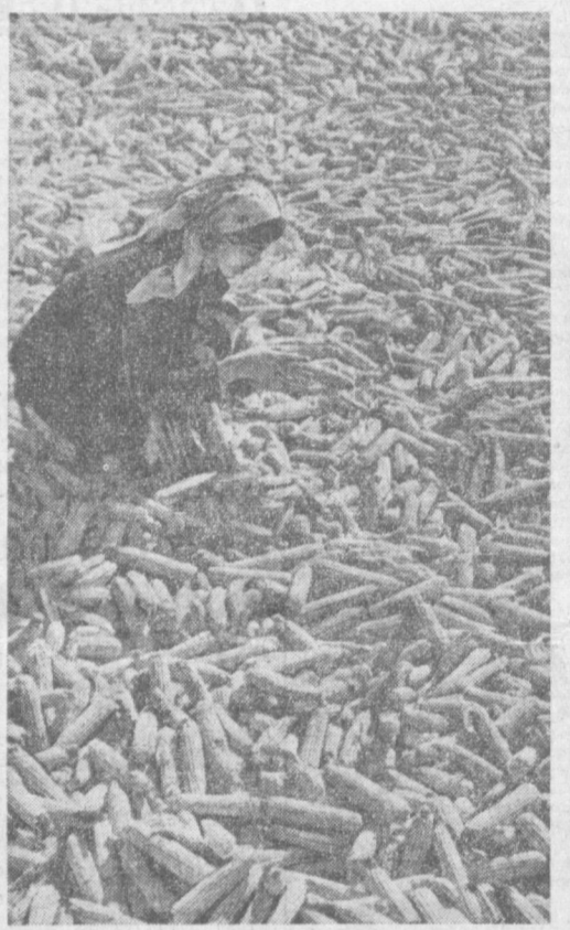
Колхоз имени Навои считается одним из лучших хозяйств в Джизакском районе. Сейчас здесь полным ходом идет сбор кукурузы на зерно. На снимке: сушка кукурузы.

От имени Всенародного комитета и миллионов участников движения болгаро-советской дружбы Ц. Драгойчева заявила, что болгарский народ всегда будет в первых рядах всенародного похода за укрепление и углубление дружбы и братского единства с могучим Советским Союзом.