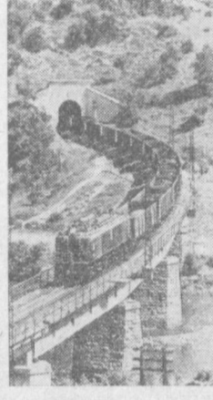
С ГОРНЫХ круч до лазурного моря — таков путь грузинского маршала. Добытый в горных рудниках Чхатури, он доставляется по накатным дорогам на обогащательные фабрики Петриковского порта в адрес страны и 10 иностранных государств направляется в специальные контейнерах ферросплавы. На снимке: железнодорожные эшелоны с грузинским марганцем идут по ущелью реки Каврилы.