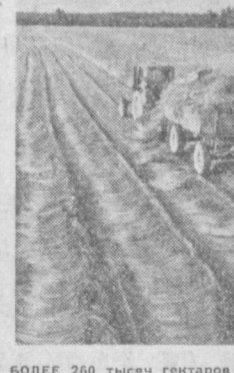
БОЛЕЕ 260 тысяч гектаров занимают в Белоруссии посевы льна. Уборка этой культуры в полном разгаре. С каждого гектара механизаторы получают по 5,5 центнера семян. На снимке: уборка льна в колхозе имени Мичуринца Савицкого района.