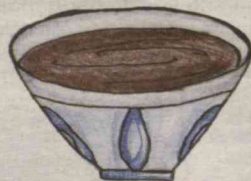
Painter: Sumbula MELIMURODOVA