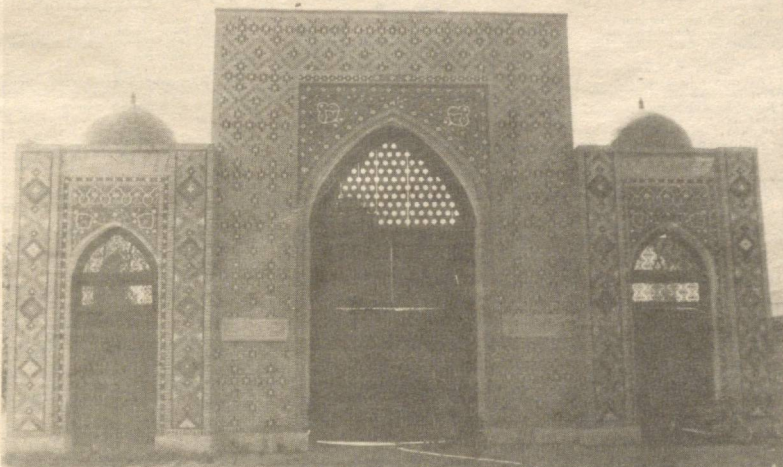
БУХОРО. Абдуҳолиқ Фиждувоний мақбараси

Зоту насабларингизни (авлод ва аждодларингизни) яхши таниб олинглар, токи қариндошлар билан алоқа яхши бўлсин. Ўзи яқин тургани билан ўзаро муруввати бўлмаса, унинг яқинидан фойда йўқ. Ўзи узоқ тургани билан бир-бирига муруввати яхши бўлса, узоқлигининг зарари йўқ.