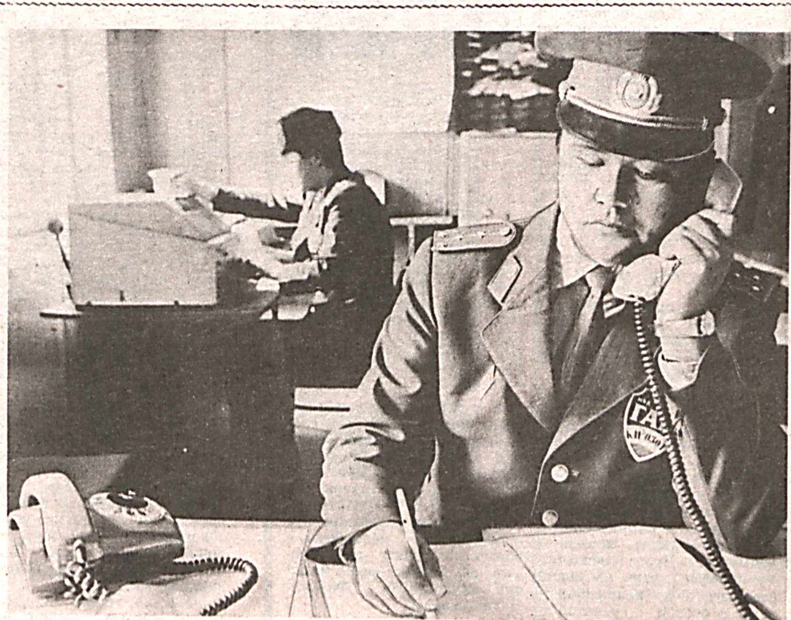
Сюда в дежурную часть ГАИ МВД Советской республики Каракалпакстан стекаются сообщения о самых различных происшествиях, авариях, преступлениях. Многие зависят от четкости в действиях, профессиональной подготовленности тех, кто заступает на

Коллектив УВД Кашкадарьинской области призывает вас, товарищей по службе, поддержать нашу инициативу и принять участие в ленинском субботнике, сделать его праздником и акцией милосердия.