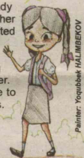
Painter: Yoqubbek HALIMBEKOV

Asila went to bed dreaming of the adventures that would take place the next morning. It would be her first day of school. Asila woke up early in the morning and get ready for the school. She hurried to the breakfast table where her breakfast was ready. She ate happily. She was very excited for the classroom activities. Alisa and her mother with father rushed to the stand where other kids were waiting for the bus. Kids talked about the fun they were going to experience at school. The bus stopped at the corner. All the kids climbed into the bus. Asila waved goodbye to her mother and father as she moved towards the bus. Asila's mother and father also waved her goodbye as she started for her school. They were excited too for their daughter. The bus stopped at the school after a short ride. The school was quite big. Kids were excited to see the school as they stepped out of the bus. All the children moved towards the entrance gate. (To be continued).