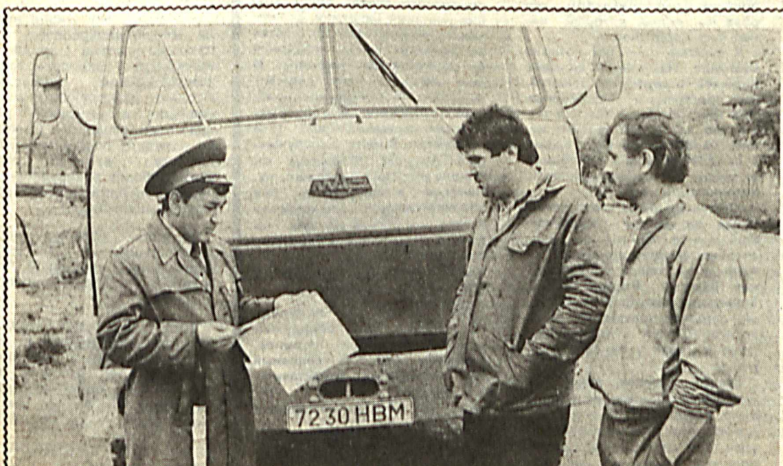
Груз задержки. Стиральные машины «Десна» отправляются обратно в Навон.