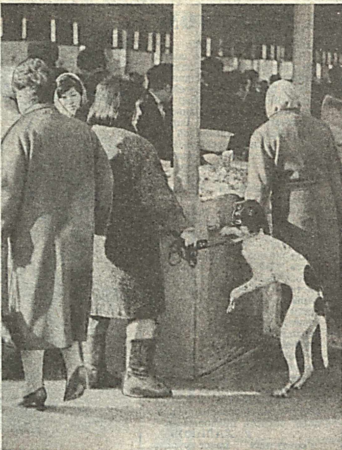
И цены тоже кусаются!