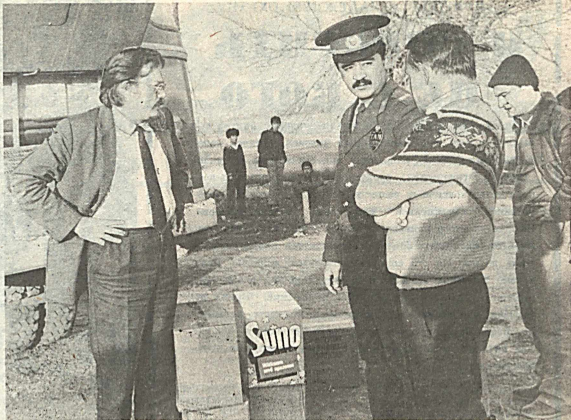
И что только ни пытаются незаконно вывезти за пределы республики!