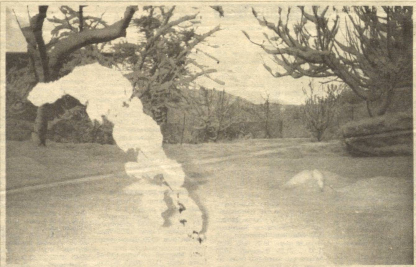
Баҳор, ёз, куз — уч ой она Ер, То кишгача ишлади қанча.