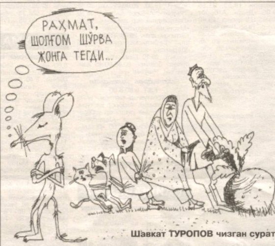
Шавкат ТУРОПОВ чизган сурат.