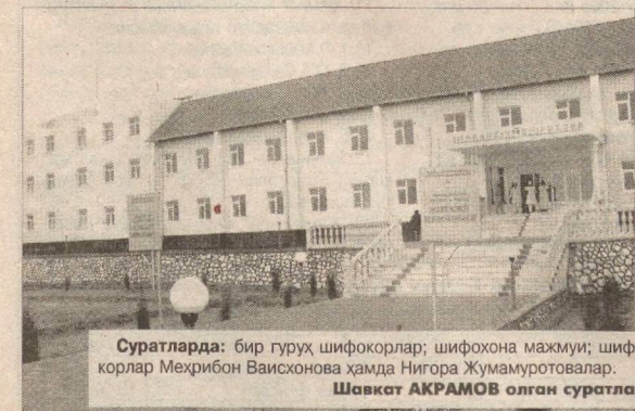
Суратларда: бир гуруҳ шифокорлар; шифохона мажмуи; шифокорлар Меҳрибон Ваисхонава ҳамда Нигора Жумамуротовалар.