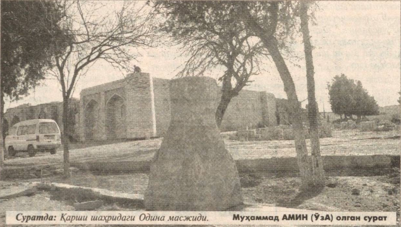
Суратда: Қарши шаҳридаги Одина масжиди.