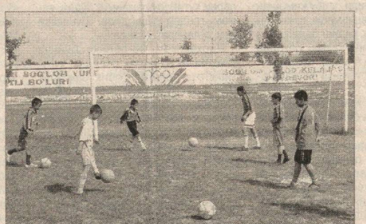
Суратларда: футбол мактаби тарбияланувчиларидан бир гуруҳи; ёш футболчилар машқ пайтида.

Жиззах шаҳар халқ таълими бўлими қошидаги Болалар ва ўсмирлар футбол мактабиде бугун 680 нафар ёш ўз маҳоратини ошираётган. Уларга 7 нафар тажрибали мураббий устозлик қилмоқда.