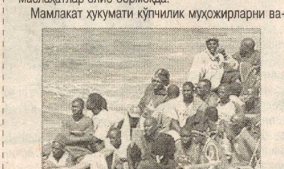
Мамлакат ҳукумати кўпчилик муҳожирларни ва-

Испания Фарбий Африкадан денгиз орқали етиб келаётган ноқонуний муҳожирлар оқими билан курашиш йўлида Европа Иттифоқидан ёрдам сўради. Охириги ҳафта мобайнида Канар оролларида 1500 дан ортиқроқ муҳожир келган. Испания ҳукумати чегарани ҳаво ва денгиздан кўриқлашни кучайтириб, муҳожирлар оқимини қисқартириш мақсадида Африка мамлакатлари билан маслаҳатлар олиб бормоқда. Мамлакат ҳукумати кўпчилик муҳожирларни ва-