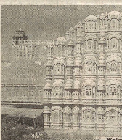
Жайпурдаги шамоллар саройи (Индустон)

Мамлакат ҳукумати кўпчилик муҳожирларни ва-