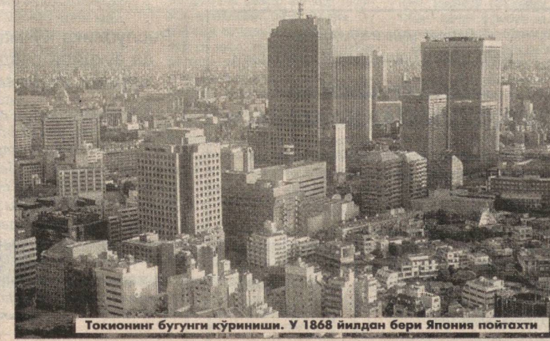
Токионинг бугунги кўриниши. У 1868 йилдан бери Япония пойтахти

Туркиянинг шимоли-гарбидидаги Баликесир музофотида жойлаш-ган конларнинг бири-да рўй берган фожиа туфайли 17 нафар кон-чи ҳалок бўлди. Музо-фот маъмурияти раҳ-бари Салоҳиддин Хо-тиб ўғлининг маълум қилишича, фожиа пай-тида конда 57 нафар ишчи бўлган. Қолган 40 нафар кончи қутқа-риб олинган. Дастлабки хабарлар-га қўра, ҳалокат 150 метр чуқурликда газ портлаши оқибатида содир бўлган. — Маълумки, яқинда Ўзбекистон Республикаси «Қизил китоб»нинг икки жилди қайта нашрдан чиқ-ди. Бу яқин албатта. Аммо уни варақлаган киши фло-ра ва фаунага тўбора қаш-шоқлашиб, ўсимлик ва ҳай-вон турларининг сони ка-майиб кетаётганига гувоҳ бўлади. — Мамлакатимизда муста-