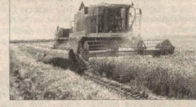
кўрсаткич янада юқори — 55-65 центнердан ошиб кетди.