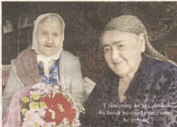
Uymizning ko'riki davlati bo'lmish buvijonlarimiz omon bo'lishsin.

Biz – bolalar qorli kunlar tezroq kelishini orziqib kutar edik. Uy vazifalarini bajarib bo'lgach, tancha atrofida yig'ilib, uzun qish kechalari buvimning ertak, dostonlarini tinglardik. U kishi juda ko'p o'zbek xalq ertaklarini bilar, ularni shunaqangi zavq bilan aytardilarki, ertaklar bir-biriga ulanib, vaqtning qanday o'tganini ham bilmay qolar edik. «Uch og'a-ini botirlar»dagi kenja ukaning jasorati, «Hotamtoy»dagi