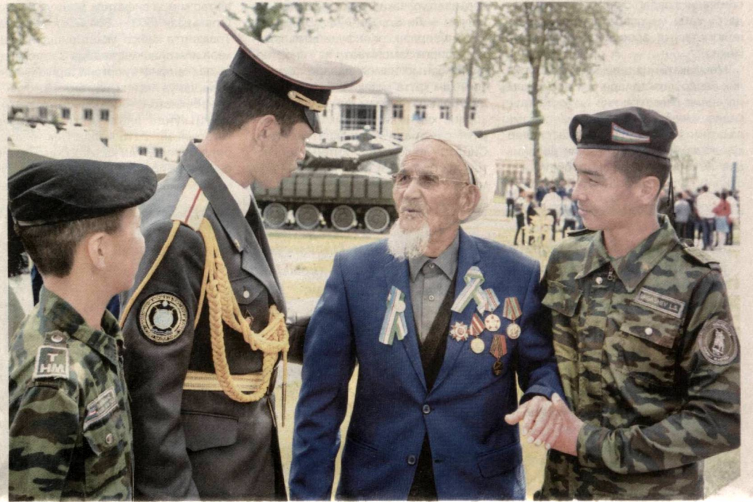
Қарши шаҳридаги “Ватанпарварлар боғи”да Хотира ва қадрлаш куни олдида “Уч авлод учрашуви” маданий-маърифий тадбири ўтказилди.

Тадбирда юртимиз тинчлиги, халқимиз фаровонлиги йўлида жасорат, матонат ва фидойилик кўрсатган Иккинчи жаҳон уруши қатнашчиларига юксак ҳурмат-эҳтиром кўрсатилди. Нуронийлар уруш йилларининг ситамли хотираларидан сўзлаб берди,