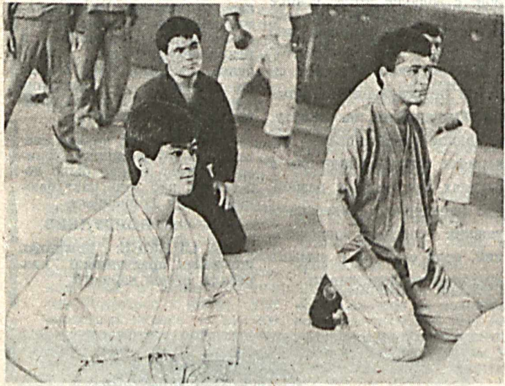
В тренировочном зале.