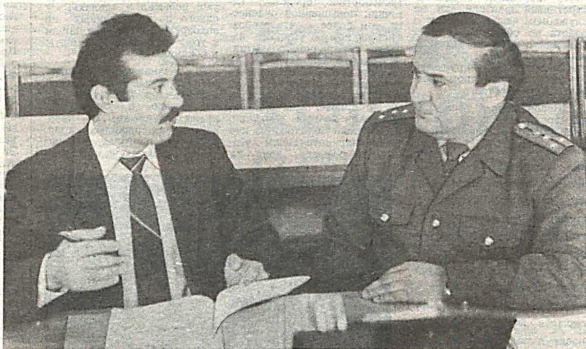
Комплексной бригадой сотрудников УВД закончена проверка и оказание практической помощи отделу внутренних дел Гиждуванского райисполкома. Старший инспектор по особым поручениям УВД старший лейтенант