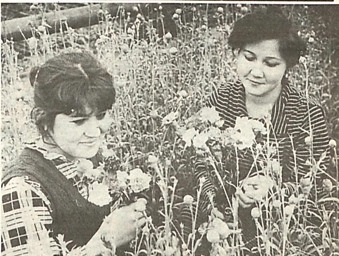
Цветы весной пользуются особым спросом. Каждый мужчина старается прийти домой с букетом красивых гвоздик, тюльпанов, роз... Обеспечить более чем двухмиллионный город цветами не так легко. Но в Ташкенте и радости горожан в цветах недостатка не испытывается.

Л. СНИЦЫНА, старший инженер НИЛ УПО МВД Республики Узбекистан.