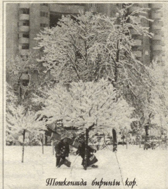
Тошкентда биринчи қор.