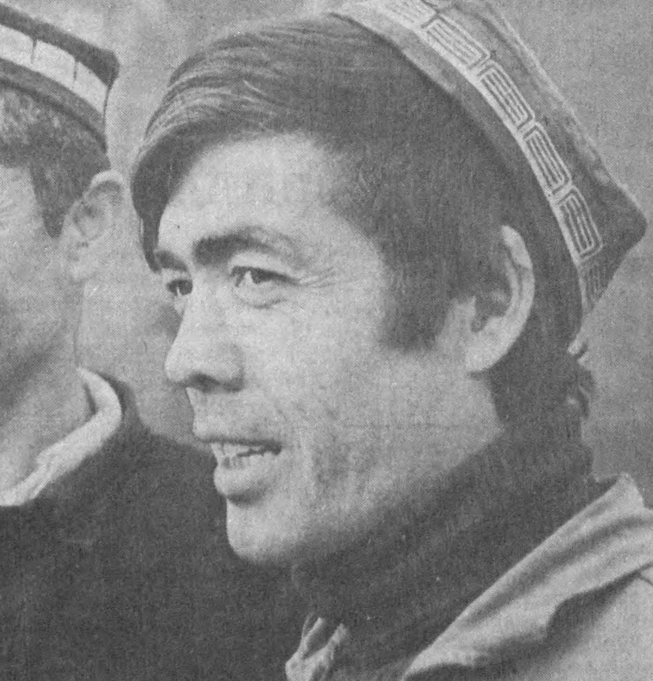
Фарғона обалсти. Бағдод районидида «Пахтакор» колхозиде деҳқонлар 1989 йили қувончли натижалар билан яқунлашди.

Р. ИРИСОВ, Москва олий партия мактаби тингловчиси.