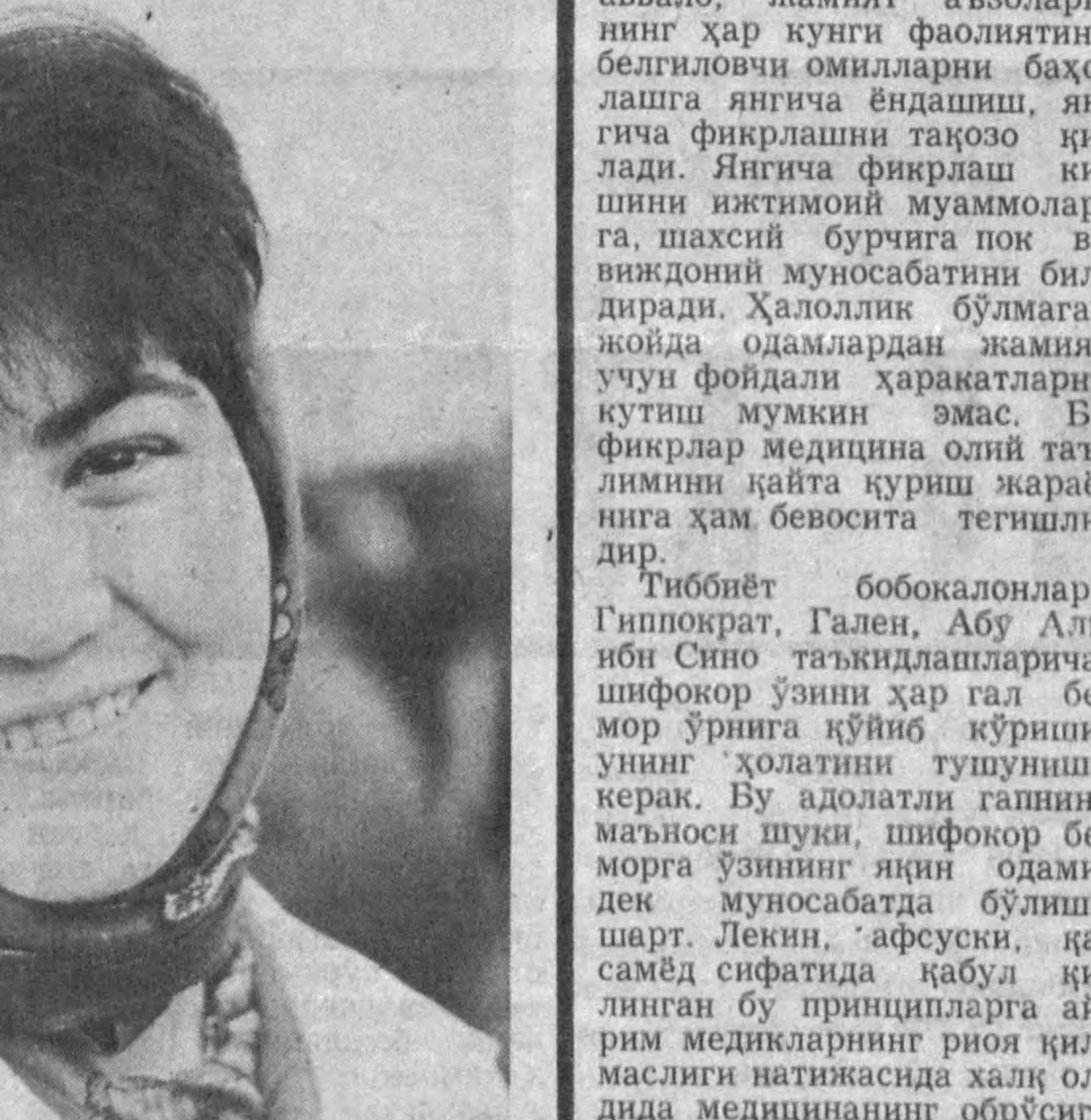
Сирдарё обалсти, Бахмал районидида «Рассвет» совхозиде қишлоқ хўжалигини муваффақиятли ўтказишга ҳаракат қилаётган.