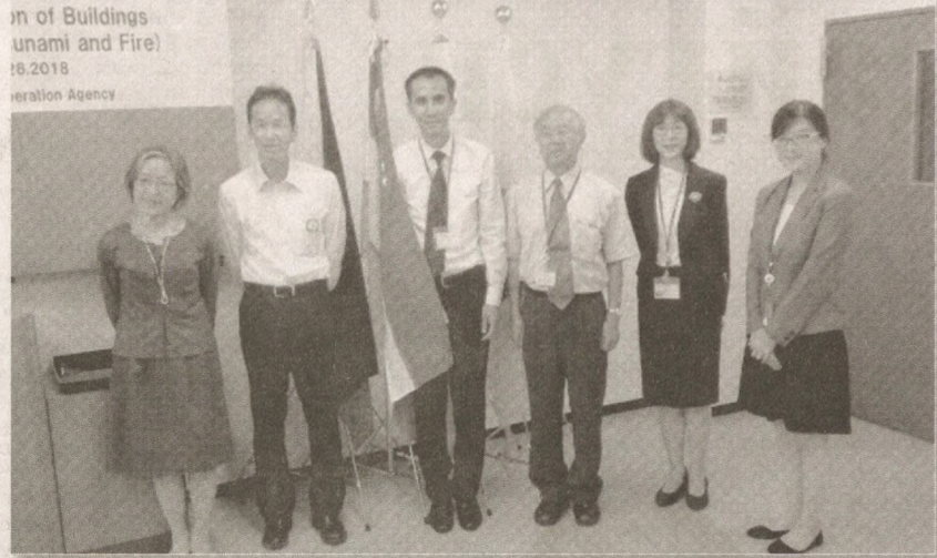
in of Buildings (unani and Fire) 18.2018 Iteration Agency

бошқалардан таҳсил олдик. Кобе, Киото ва Цукуба шаҳарларидаги илмий-тадқиқот марказлари фаолияти билан яқиндан танишдик. Мисол тариқасида янги бир технологияни тилга олиб ўтаман. Япониялик айрим муҳандислар қуйидагича мушоҳада юритишган: zilзила фақатгина ерда турган унсурлар учунгина хатарли. Заминдан озгина бўлса-да узилган объектларга эса