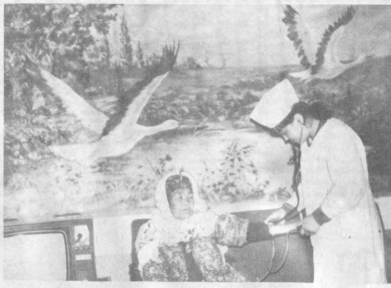
Сўлим ва баҳола табиат қўнида дам олишини ҳам ўз вақти бор. Шу мақсадда республикамизда кўпгина соғалаштириш марказлари ташкил этилган Касби туманининг «Майман» санаторийи ҳам ана шундай шифобахш масканлардан. Бу ерда дала меҳнатқиларининг мириқиб дам ва муолажа олишлари учун барча шарт-шароитлар мавжуд. Шунингдек, беморларни яна билан даволан ҳам йўлга қўйилган.

тон Республикаси Олий Мажлисининг 12 сессиясида Президентимиз Туркистон улқаси халқлари ўзаро дўст ва биродар яшашлари бу минтақада фаровонликни яратибди асосий омил эканини таъкидлади.