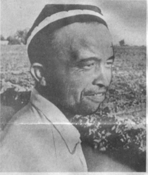
Оқолтин туманидаги «Фаргона» деҳқон фермерлар бирлашмаси пахтакорлари амалдаги йилда 2036 гектар ерда гўза ўстиришяпти. Азамат деҳқонлар ҳар гектар майдондан 35 центнердан ҳосил олишни ният қилишган. Агротехник тадбирлар ва сугориш вақтида сифатли адо этилаётир.