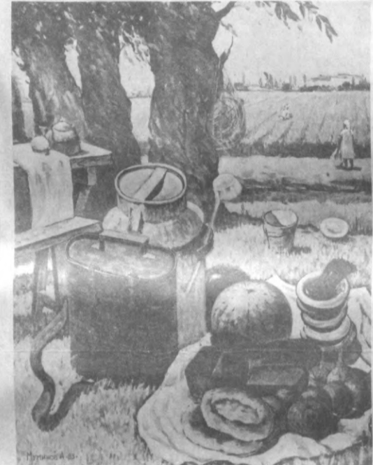
«ДАЛАГА ТУШЛИК КЕЛТИРИЛДИ» Мусаввир А. МҮМИНОВ асаридан репродукция.

дил ҳаётини фаоллаштири яратишда ва ишчи кўчларини таъминлашда, ижтимоий ишлаб чиқариш жараёнида ҳам асосий омилдир. Табиат чўқур текширилгани сари ҳам битмас-туганмасдир. Унинг сир асрори тисимотлардан иборат. Фанда эришилган ютуқлар табиатдаги умумий боғлиқликларни ривожлантиради. Экинзорлар ҳозирги пайтда ер шарини қўриқлигининг 10 фозига инсонни ташкил этади. Қолган 90 фозини эса, ўрмонлар, ўтлоқлар, яиллолар, ботқоқликлар, шаҳар хивоблари, оромгоҳ ва бошқа қўқаламзор майдонлар ташкил этади. Атмосферада табиий тозаланиш жараёни рол бериб туради. Атмосферани соғломлаштиришда усимликлар бениҳоя катта аҳамиятга эга. Мавжуд кислотароднинг учдан бирига яқинини қўруқликдаги яшил усимликлар ишлаб чиқариб, қолганини дунё ўқмониди сува усимликлари берилади. Усимликлар ҳаводаги чанг ва газларни ўшлаб қолиб, механик ва кимёвий филтёр вазифини ўтайди, яъни углеродни ўзлаштириб, соф кислород ажратиб чиқаради. Яна шу нарса ҳам ҳисоблаб чиқилганки, бир гектар жойдаги яшил ўт-ўлан бир соатда икки юз киши чикарганда ҳосил бўлади. Табиатда табиий газларнинг усимликлар ҳаводаги чанг ва газларни ўшлаб қолиб, механик ва кимёвий филтёр вазифини ўтайди, яъни углеродни ўзлаштириб, соф кислород ажратиб чиқаради.