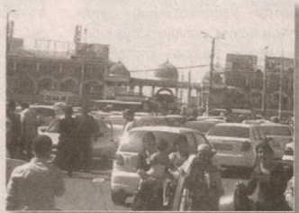
битта баҳона тўқилди...

Кечаги якшанба, соат тонги 6. “Чилонзор буюм бозори”, халқ тилидаги “Отчопар” дамиз. Бир ёқда хира киракшлар, бир ёқда эса ёймачилар ер устию ер остигача эгаллаб олган. Зўрга “Бек барака” томонга ўтволдик. Уч болам билан кўл ушлашиб олганмиз. Ҳали ичкаридаги дўконлар ёпик, йўл устини эса тўлагича “бирровчи” савдогарлар эгаллаб олган (уларнинг патта пули кимнинг чўнтагига тушиши номаълум).