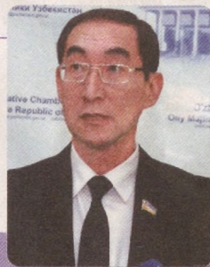
Тўлқин КАРИМОВ, Олий Мажлис Қонунчилик палатасидаги О‘zLiDeP фракцияси аъзоси