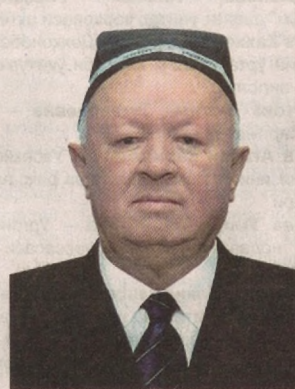
Normuradov Hasan Norbekovich

Мамлакатимиз иқтисодий салоҳиятини мустақамлаш, унинг жаҳон миқёсидаги шон-шухратини юксалтириш, Ватанимиз ободлиги, турмушимиз фаровонлигини таъминлаш борасидаги улкан хизматлари, сўнги йилларда юртимизда жадаллик билан олиб борилаётган туб ислохотлар жараёнидаги ташаббускорлиги ва фидойилиги, давлат ва халқ манфаатларини рўёбга чиқариш йўлидаги фидокорона меҳнати, ишлаб чиқариш ва ижтимоий-маънавий соҳалардаги кўп йиллик самарали ва ибратли фаолияти, ёш авлодни ватанпарварлик, миллий ва умуминсоний қадриятларга ҳурмат руҳида тарбиялашга қўшган катта ҳиссаси ҳамда ижтимоий ҳаётдаги фаол иштироки учун қуйидагиларга “Ўзбекистон Қаҳрамони” унвони берилиб, олий нишон – “Олтин юлдуз” медали топши-