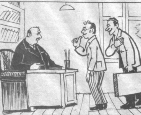
— Хўжайин, бу кишини ишдан бўшатманг, «ўзининг одам».