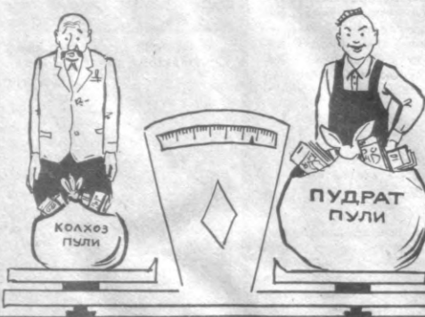
— Пудрат тарози босди.