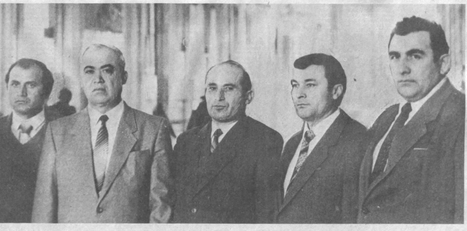
СУРАТДА: қурултой қатнашчиларидан бир гурӯҳ.

гини, куч-қудратини, мудофаа қобилиятини ошириш манбаларидан бири бўлиб келди ва шундай бўлиб қолади. Пахтаимизга, пахтакорлигимиз шаънига бир тўда муттаҳамлар, пораҳўрлар, шўхратпарастлар, маънавий-ахлоқий нопок шахслар томонидан туширилган дошювиди, ювилмоқда ва батамом ювиб ташланади. Ўзбек деҳқонининг юзини ерга қаратган, қоматини ҳам қилган, рўзғори баракасини