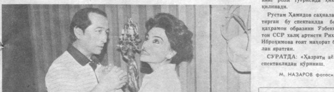
Суратда: «Ҳазрат аёл» спектаклидан кўриниш.

Халқаро театр кунини томошабинларга маданий хизмат кўрсатадиган ижодий коллективлар имонияти, актёрлар маҳорати, режиссура санъатининг янги кирраларини ишлаб кўришди. Бинобарин, ҳар бир театр бу байрамга алоҳида тайёрлик кўради, уни муносиб совға билан кутиб олишга ҳаракат қилади.