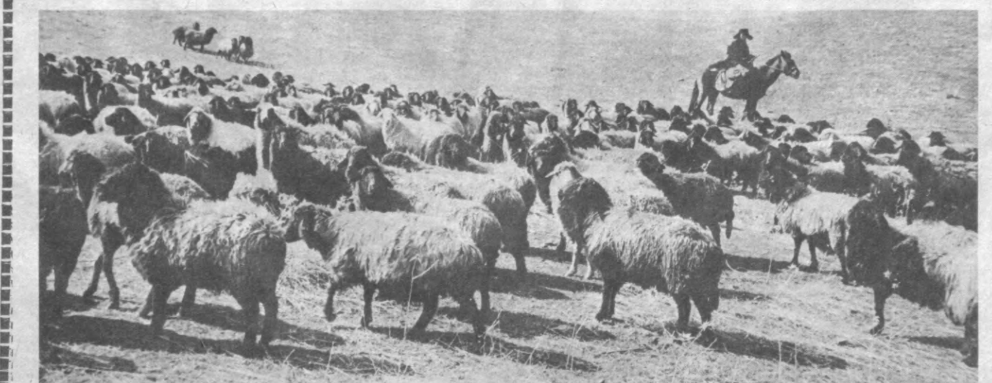
СУРАТЛАРДА: 1. Бош чўпон Тоштемир Тўраев. 2. Қўй-қўзи лар яйловда.