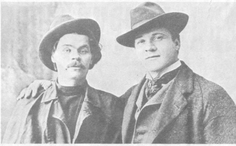
СУРАТДА: М. Горький машҳур артист Ф. Шаляпин билан.

Максим Горький рус адабиётининг, рус халқининг даҳоларидан бири бўлиб, ҳатто жаҳон адабиётида янги даврини — социалистик реализм адабиёти даврини бошлаб берган улуг санъаткордир. У халқнинг тарихин яратувчи, ҳаётни ўзгартирувчи буюк кучига юксак баҳо берди, меҳнаткаш инсонга бахт-саодат башх шувчи жамиятни фақат социалистик революция орқалигина барпо этиш ва бу революцияни ишчилар синфи бошчилигидагина амалга ошириш мумкин, деган улуг гоини олган сурди. Шунинг учун доҳиймиз В. И. Ленин 1909 йилда ёзган бир мақолисида: «Урғоқ Горький ўзининг буюк бадиий асарлари билан ўзини Россиядаги ва бутун дунёдаги ишчилар ҳаракати билан жуда ҳам мустаҳкам боғлаган», — ёзувчи дейди. 1917 йилда ёзган «Ироқдан хатлар»да доҳиймиз: «Шубҳа йўқки, Горький гоини катта санъаткор, талант эгасидир, у бутун дунёдаги пролетар ҳаракатига жуда кўп фойда келтирди ва бундан кейин ҳам келтирарди», — деб таъкидлаган эди.