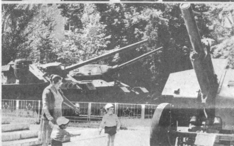
Эл-юрт нефтхори, чексиз фазриси. Кувонамиз сизга бермоқдан салом.