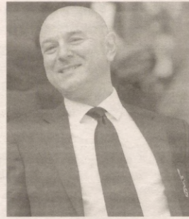
Президент «Тоттенхэма» Дэниел Леви

– Это мечта каждого тренера. И если тренер хочет уйти, он уходит. Но я только что подписал с «Тоттенхэмом» новый контракт. Леви отказался рассматривать все их предложения. А если бы меня попросили разорвать конт-