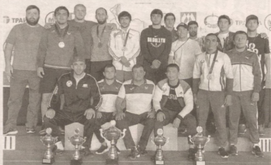
Сборная Узбекистана выступила успешно. Наши соотечественники завоевали по две золотые и серебряные, а также три бронзовых медали.

В столице Беларуси завершился международный турнир по вольной борьбе на призы Александра Медведя. Эти соревнования из серии Гран-при служат этапом подготовки перед чемпионатом мира.