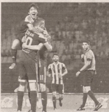
Было зафиксировано несколько неожиданных результатов.

В минувшие субботу и воскресенье все матчи 16-тура Суперлиги Узбекистана начались с минуты молчания в память об ушедших в небеса пахтакоровцах.