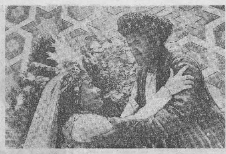
Отағий ноғидати Хоразм область музыкали драма ва комедия театри жиддий коллективия СССР ташиқит этилганлигининг 60 йиллиги мусобаоти билан мукажигина сиктакларини сахналаштирди. «Ониқ Гариб ва Шоҳсанам» музыкали драмаси ана шундай юбилей спектаклиридиндир.