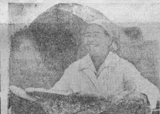
Райондаги барча бригада-ларнинг дала шийончида тадбир курилган. Унда дала-да ишлаётганлар учун жо-ла

— Бизда шундай тартиб бор: тулди дам олтиш пайти — соат бирдан утчага осо-