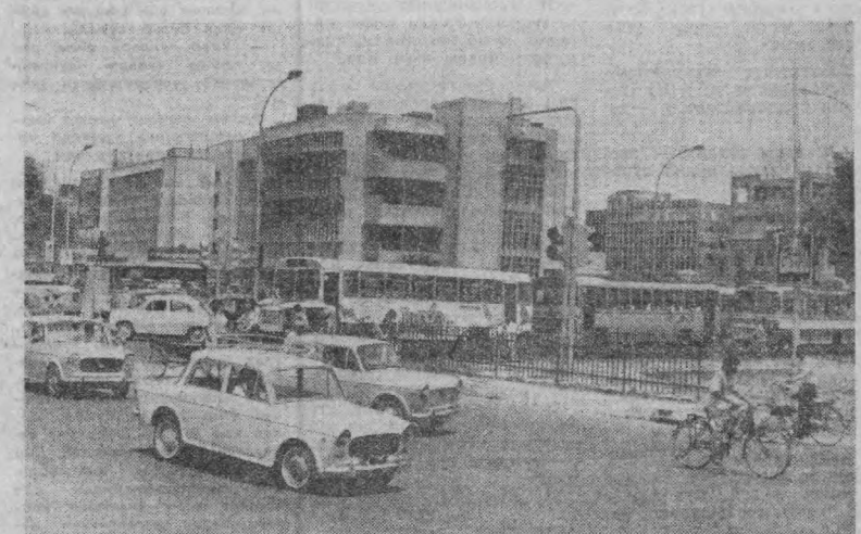
Суратда: Хиндистон пойтахтининг марказий қўчаларида бирнда.